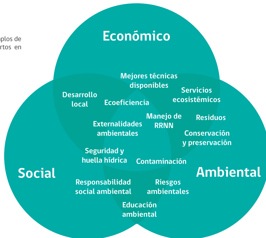
Figura 3: Algunos ejemplos de temas relevantes insertos en los ámbitos del AVGC

Por su parte, las acciones individuales podrán incorporar sus planes de trabajo, herramientas y recursos hacia los objetivos del acuerdo y/o potenciarlas en relación a su rol y quehacer. A modo de ejemplo, las acciones podrían estar referidas a temáticas sociales, ambientales o económicas, contribuyendo a generar resultados en las siguientes materias: