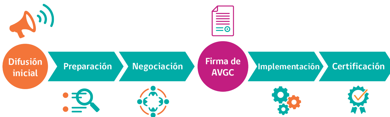
Figura 1: Esquema conceptual del proceso de participación de la metodología AVGC.

se comprometan a implementar, ya sea de manera individual o colectiva, y serán formalizados en el acuerdo territorial que suscriban. Estas acciones deberán reflejar estándares superiores a los exigidos en el marco regulatorio vigente y significar una mejora de su gestión en el territorio. A su vez, no podrán afectar el cumplimiento del marco normativo, ni el ejercicio de las facultades de los organismos competentes.